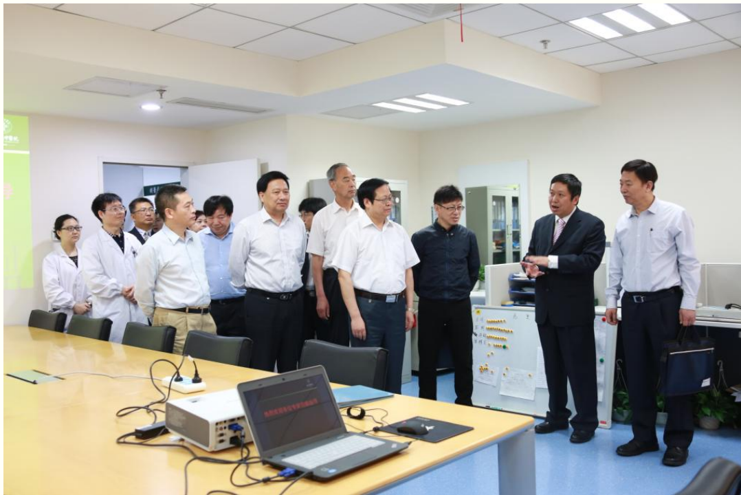
专家组走访我校直属附属医院湖北省中医院光谷院区

专家组成员根据我校的自评报告和汇报内容，对内涵建设、人才培养等问题进行询问，并与我校领导进行了深入的探讨与交流。