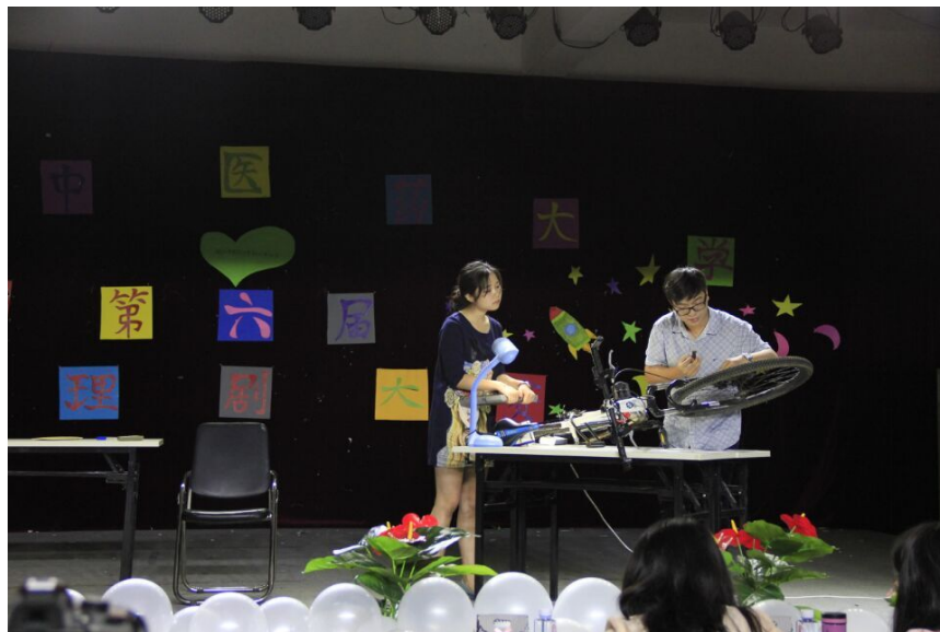
同学们表演心理剧