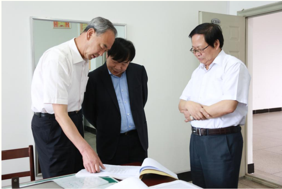
专家组查阅相关资料