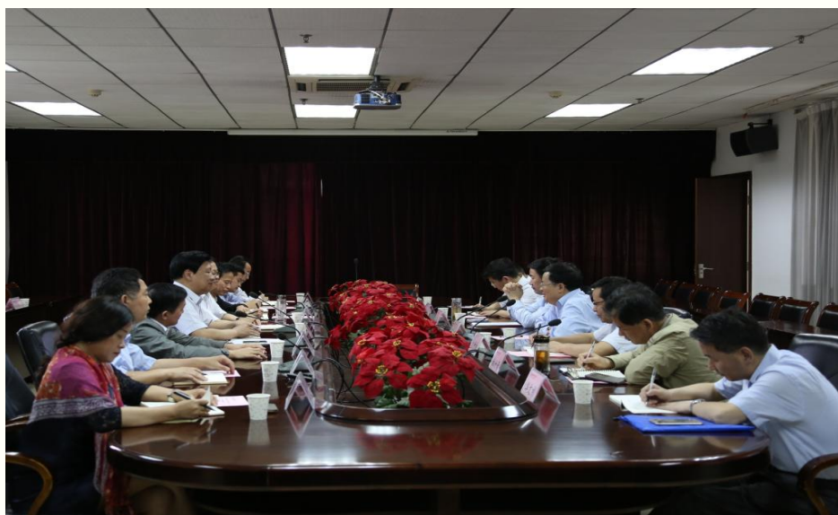
湖北省副省长郭生练来校调研