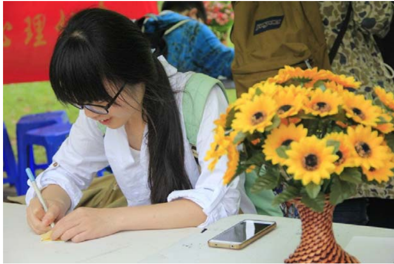
故事当铺活动现场